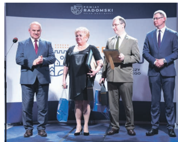
Nagroda dla Niepublicznego Przedszkola w Jedlińsku

zostało Niepubliczne Przedszkole i Żłobek „Gumisiowa Kraina”. W 2020 roku uczęszczało tam w sumie 8 grup dzieci w różnym wieku.