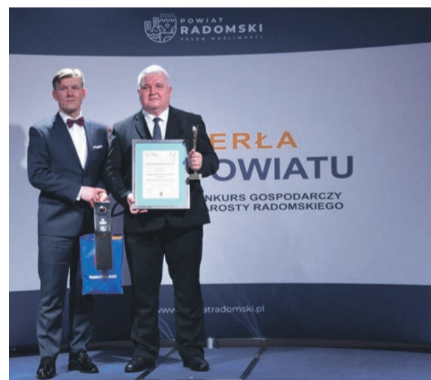
Nagroda specjalna dla Zakładu Mleczarskiego FigAND

O dobre wspomnienia kulinarne zadbał partnerzy wydarzenia: Hotel Rubin w Kiełbowie Starym koło Białobrzegów, Selgros Cash & Carry oraz firma Agnesbud.